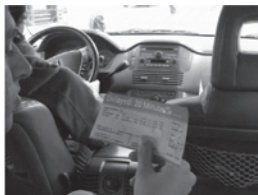
b) A câmera reconhece o cartão de embarque e projeta informações atualizadas sobre o horário da partida no ticket .