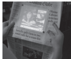
c) A câmera reconhece uma notícia de jornal da internet e projeta um vídeo na página.

Até agora, enfatizamos tecnologias que estão possibilitando o surgimento da computação pervasiva, mas a “computação ubíqua” não denota apenas uma tendência técnica; ela é, igualmente, uma formação sociocultural, um imaginário e uma fonte de desejo. A partir de nossa perspectiva, seu poder se torna transformador ao permear o âmbito afetivo, o inconsciente maquínico. Talvez o desenvolvimento mais significativo que move essa reconfiguração do afeto são os fenômenos das redes sociais e do uso dos smartphones . Mais pessoas estão não somente gastando mais tempo online; elas estão procurando fazê-lo junto com outros “amigos” conectados. Levantamentos do Projeto Internet e Vida Americana do Pew [Centro de Pesquisas] relatam que, entre 2005 e 2008, o uso de sites de redes so-