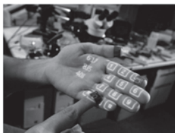
a) Teclado de telefone ativo projetado na mão do usuário.

Figura 1: O SixthSense de Pranav Mistry e Pattie Maes. O sistema compreende um projetor de bolso, um espelho e uma câmera embutidos em um dispositivo vestível conectado a uma plataforma computacional móvel no bolso do usuário. A câmera reconhece objetos instantaneamente, e o microprojektor projeta as informações em qualquer superfície, inclusive no objeto em si ou na mão do usuário.